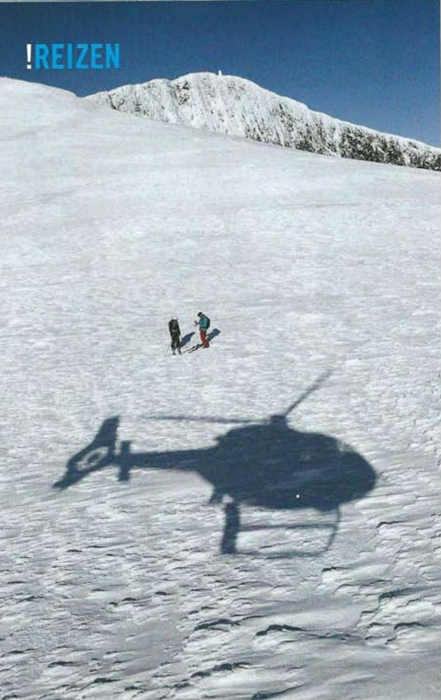
Ook heliskiën behoort tot de mogelijkheden in Åre

D e entree tot het meest vriendelijke skigebied van Europa is ronduit spannend, want het blijkt niet mogelijk om te kunnen landen. Het vliegveld van Östersund, op zo'n 45 minuten van Åre, is dicht vanwege de mist en de laaghangende bewolking. Bij de eerste landingspoging sluit het wolkendek zich op geringe hoogte en moet uitgeweken worden naar een nabijgelegen vliegveldje wat speciaal hiervoor wordt opgehouden. Na een uur oponthoud zet de vrouwelijke piloot het toestel weer in beweging met de mededeling het toch weer te gaan proberen. Vier rondjes worden gedraaid boven een wolkendek dat Åre en Östersund geheel aan het oog onttrekt. Plots ontstaat er een minuscule opening boven het begin van de landingsbaan. De piloot bedenkt zich geen moment en gooit onder een steile hoek het vliegtuig door het gat om te voorkomen