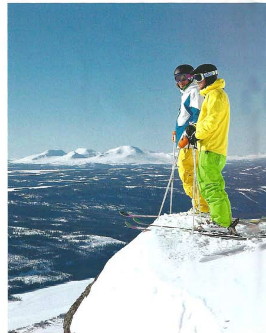
Rechts: Adembenemend uitzicht met in de verte Noorwegen

Na vijf dagen van 's morgens tot 's middags in de sneeuw te hebben gestaan, de après-skigelegenheden afgewisseld te hebben met een Zweedse sauna om vervolgens naadloos door te gaan in het nachtleven tot diep in de ochtend, kunnen we volmondig stellen dat Åre een van de meest sublieme wintersportoordelen van Europa is. Dat dit in het overgrote deel van Europa nog niet zo bekend is, is vreemd maar misschien niet jammer; zo blijft een fantastisch skigebied toch redelijk intact en kun je er nog naar hartenlust ongedwongen genieten. ■